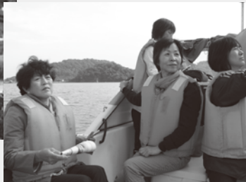
▲10月30日 ピースリングツアー