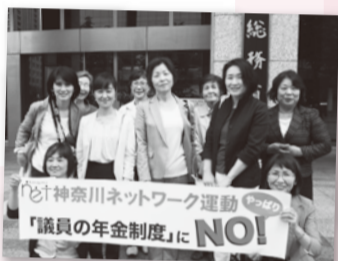
国会でロビー活動 2017.6.1